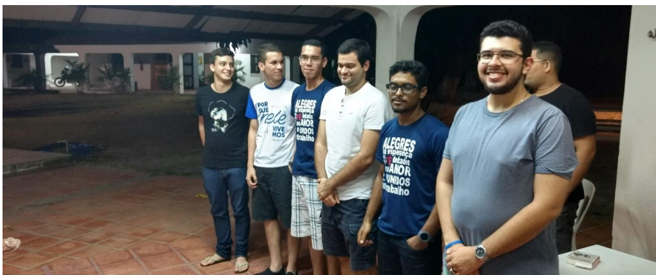
Congresso da Federação Leste do Ceará – Diretoria Eleita – Novembro/2019