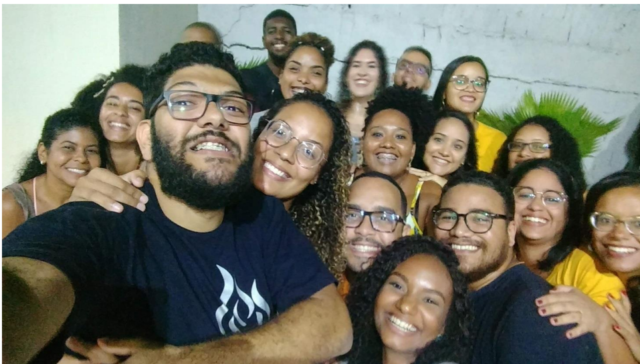
Minha Turma – No aniversário da CSM Central da Bahia – Março/2020