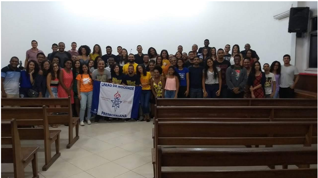
Aniversário da CSM Central da Bahia – Minha Sinodal