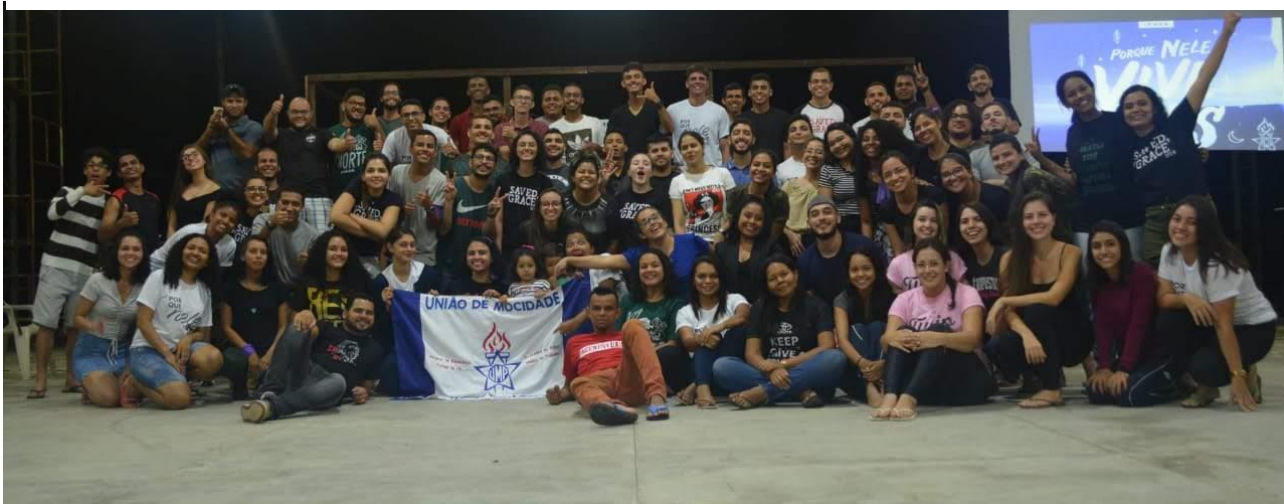
Acampamento Federação de Roraima – Novembro/2019