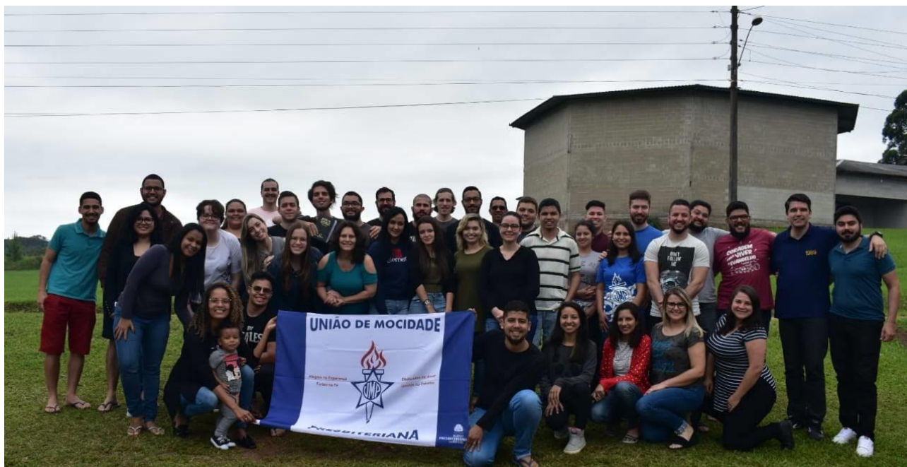
Acampamento Sul do Brasil – Novembro/2019