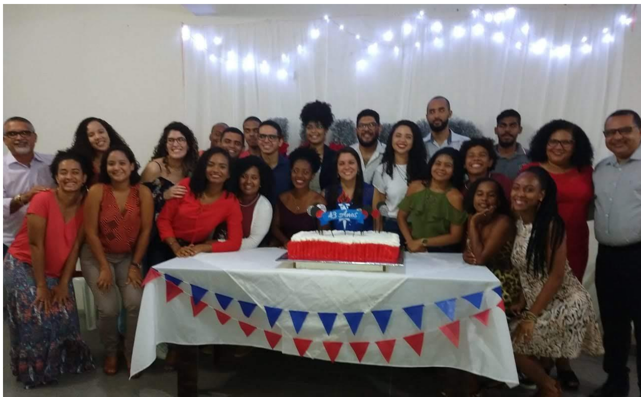
Minha Turma - Aniversário da UMP Periperi – Novembro/2019