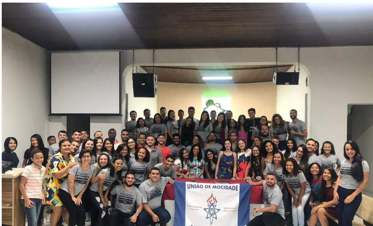
Encontro da Federação de Itamaraju – Sul da Bahia – Outubro/2019