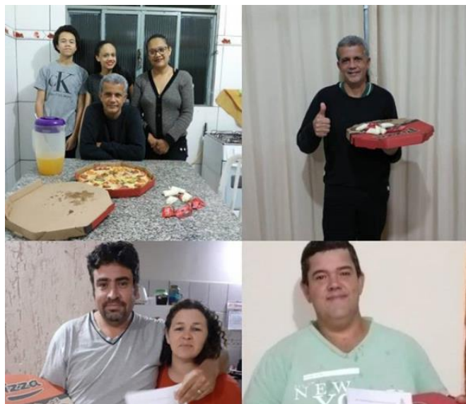
Igreja Presbiteriana em Caputira-MG participando do desafio e enviando pizzas em delivery

Mesmo com esse aperfeiçoamento do projeto não deixamos o planejamento de visitar os seminários. Esse ano, devido a pandemia, só houve visita ao Seminário Teológico do Nordeste (STNe) em Teresina-PI.