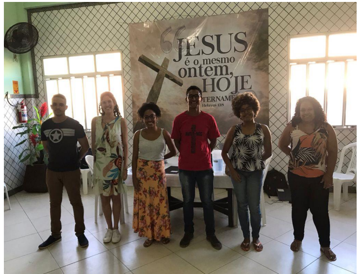
Congresso da Federação Soteropolitana