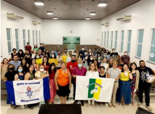
Oficina - Sinodal Piauí – Teresina-PI