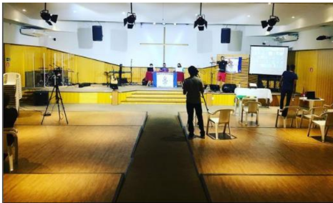
2ª CE Virtual