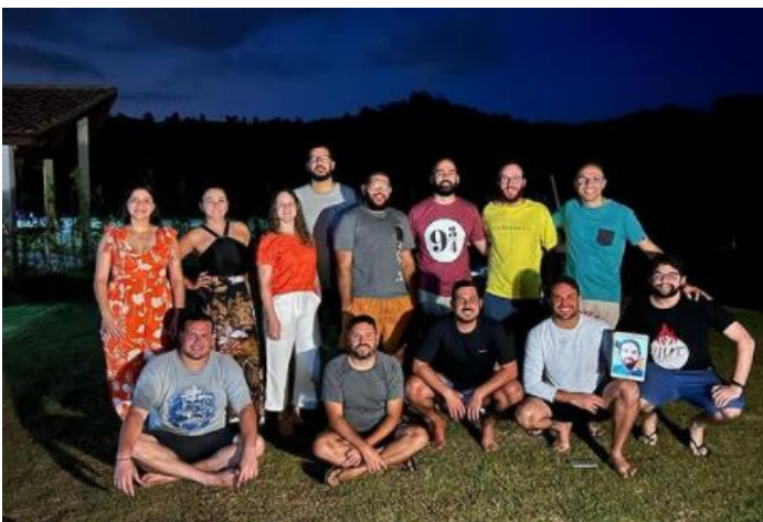
Última reunião da Diretoria e Secretariado