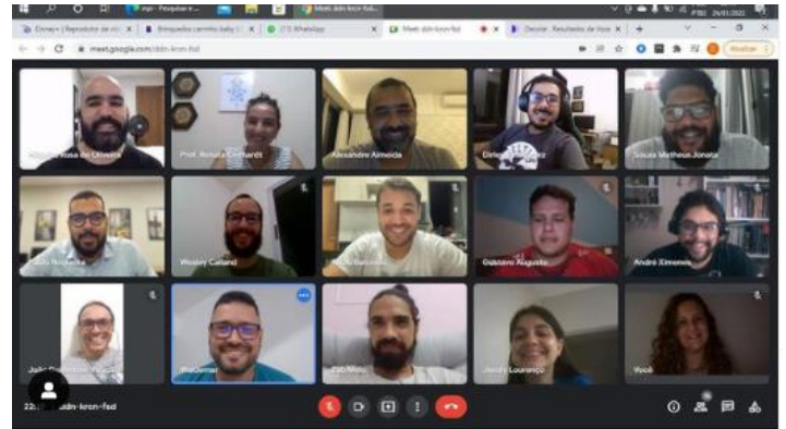
Reunião Online da Diretoria e Secretariado