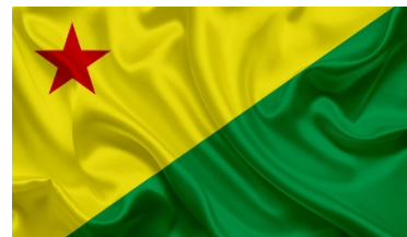
Figura 1 – Bandeira do Acre