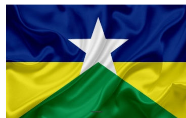
Figura 3 – Bandeira de Rondônia