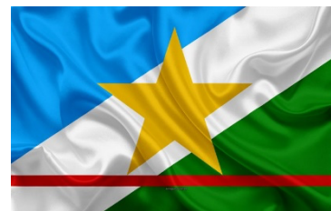
Figura 5 – Bandeira de Roraima