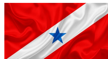
Figura 2 – Bandeira do Pará