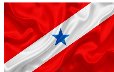
Figura 2 – Bandeira do Pará

Sinodal organizada: Sinodal que compõe a parte sul do estado do Pará. Ano de muita tentativa de comunicação com esta sinodal porém todas sem sucesso, não há a informação concreta se a sinodal de UMP ainda está em atividade. Foi planejada uma visita local, porém com o agravamento da pandemia ainda não foi realizado. Ainda continuamos tentando a comunicação por meio de ligações, mensagens, e-mails até a possibilidade e viabilidade da visita presencial ocorrer.