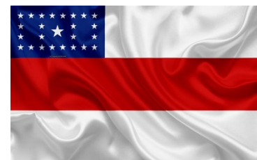
Figura 4 – Bandeira do Amazonas