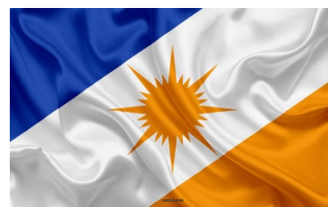
Figura 7 – Bandeira do Tocantins