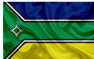
Figura 6 – Bandeira do Amapá

Federações: Nesta sinodal existem sete federações organizadas, sendo que 5 delas compõe o estado do Amazonas, 1 no estado de Roraima e 1 sendo na parte norte (oposta a CSM Carajás) do estado do Pará, assim sendo elas: PRAM - Federação do Presbitério do Amazonas, PAMA - Federação do Presbitério Amazonense, PSET - Federação do Presbitério Setentrional, PMAN – Federação do Presbitério Manaus, PSAM – Federação do Presbitério Sul Amazonas, PRER - Federação do Presbitério do Estado de Roraima e PNPA - Federação do Presbitério do Noroeste do Pará.