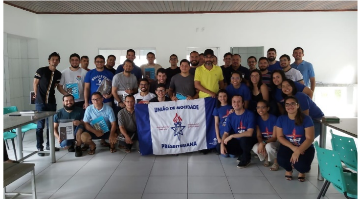
Seminário Teológico do Nordeste

Segue abaixo os seminários visitados, quando, quem fez a ação e quantos kits distribuídos: